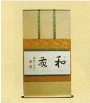
えどひようぐ ③⑩ 江戸表具

ぶし たいとう かたな よろい ぶく かざ つか 武士が台頭すると刀や鎧などの武具の飾りに使わ れましたが、えどじだい きんこうし よこやそうみん 江戸時代になると金工師の横谷宗珉が、 ちようみん まじ なか まちほり よ さくふう う 町民との交わりの中で“町彫”と呼ばれる作風を生み だし、きせる ちようじん つか どうぐ ちようきん つか 出し、煙管など町人が使う道具にも彫金が使われる ようになりました。