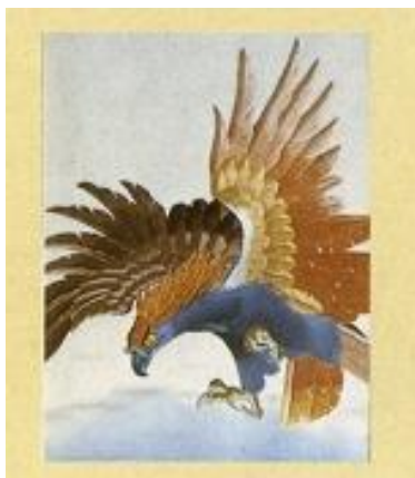
えどししゅう ②6 江戸刺繍

江戸切子の創始者とされる加賀屋久兵衛は、ガラス 製造が盛んだった大坂で修業し、今の日本橋大伝馬 町でビードロ屋を開きました。現在、江戸切子の工場 は、江東区と墨田区の2区に多くが集まっています。