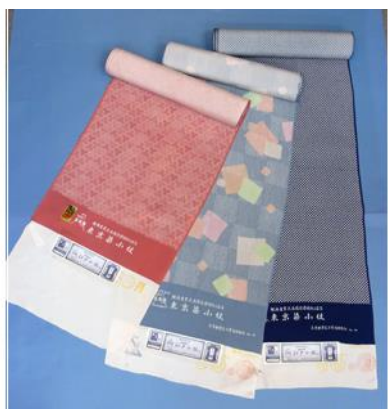
とうきょうそめこもん ②東京染小紋

めんおりもの 綿織物の「村山紬 絣」と絹織物の「砂川太織り」が ゆうごう 融合し、めいじじだい 明治時代にむらやまおおしまつむぎ つく だ 融し込み、明治時代に村山大島 紬 が創り出されたとされ ます。がら ほ いた かすりいと ま つ みぞ せんりょう なが 柄を彫った板に 絣 糸を巻き付け、溝に 染料を流 し込んで染め上げる、いたじ せんしよく 板締め染色と呼ばれる独特の技 が特徴です。