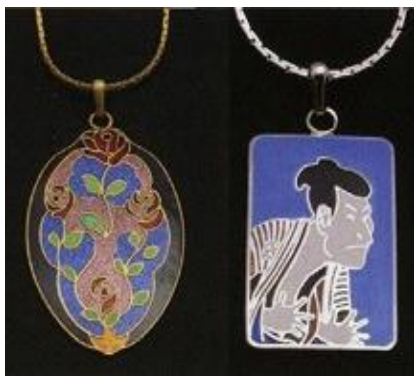
とうきょうしっぽう ③⑦ 東京七宝

江戸幕府により、町人は派手な色の着物を着ることを禁じられ、茶色や鼠色など無地染の着物が普段着になりました。“粋”を好む江戸の町人は、同じ色でも風合いなどを工夫し、「四十八茶百鼠」と言われるほど、様々な種類の色を作りだしました。