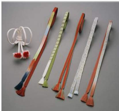
とうきょう ⑧ 東京くみひも

ぶっきょう でんらい きょう まきもの け さ、その後 きそく れいふく ぶ し たいとう かぶと よろい かたな つかまき 貴族の礼服、武士の台頭により兜や鎧、刀の柄巻な はばひろ つか え どじだいこうき じょせい ど幅広く使われてきました。江戸時代後期には、女性の おび 帯じめとしても使われるようになりました。