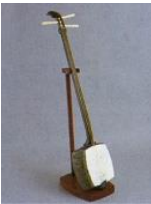
とうきょうしゃみせん ③① 東京三味線

ひようぐ かみ めの のり は あ まきもの か しく 表具とは、紙や布を糊で貼り合わせ、巻物や掛け軸、 ふすまなどをつくることをいいます。ちようじんぶんか はなひら 町人文化が花開く なか さどう しょうどう とお しょうが えどちようじん ひろ 中で茶道や書道などを通して、書画が江戸町人に広く した 親しまれるようになり、えどひようぐ さか 江戸表具が盛んになりました。