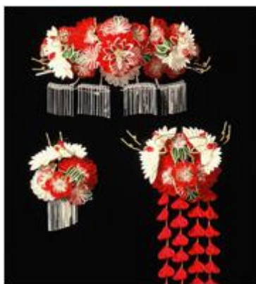
え ど かんざし ⑬ 江戸つまみ簪

え どじだい ばくふ ぶっきょう ほ こ ちょうにん ひろ 江戸時代、幕府は仏教を保護し、町人にも広まり ました。とうきょうぶつだん ねんごろ くわ けやき 東京仏壇は、1680年頃から桑・櫟などの もくざい つか とくじ わざ もち りょうしつ ぶつだん つく 木材を使い、独自の技を用いて良質な仏壇を作ったの はじ が始まりとされ、その技術は今に受け継がれています。