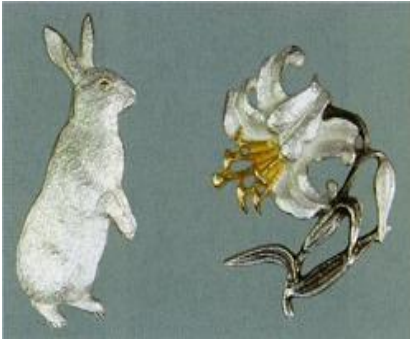
とうきょうちようきん ②⑧ 東京彫金

ぶし たいとう かたな よろい ぶく かざ つか 武士が台頭すると刀や鎧などの武具の飾りに使わ れましたが、えどじだい きんこうし よこやそうみん 江戸時代になると金工師の横谷宗珉が、 ちようみん まじ なか まちほり よ さくふう う 町民との交わりの中で“町彫”と呼ばれる作風を生み だし、きせる ちようじん つか どうぐ ちようきん つか 出し、煙管など町人が使う道具にも彫金が使われる ようになりました。