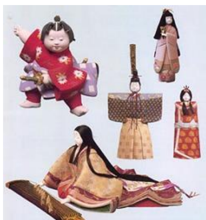
えど きめこみにんぎょう ④江戸木目込人形

えどじだい 江戸時代、ぶし 武士が着る 袴 には細かい紋様が染めら れるようになり、やがて大名ごとに決まった紋様が使 われるようになりました。だいみょう 大名のぶけやしき 武家屋敷がえど あつ まったことで、えど 江戸でのこもん 小紋のじゅよう 需要が高まり、やがて ちょうにん 町人にもひろ 広まっていきました。