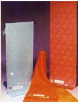
とうきょうむじぞめ ③③ 東京無地染

江戸幕府により、町人は派手な色の着物を着ることを禁じられ、茶色や鼠色など無地染の着物が普段着になりました。“粋”を好む江戸の町人は、同じ色でも風合いなどを工夫し、「四十八茶百鼠」と言われるほど、様々な種類の色を作りだしました。