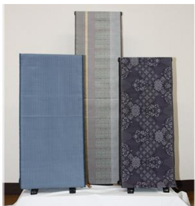
むらやまおおしまつむぎ ①村山大島 紬

めんおりもの 綿織物の「村山紬 絣」と絹織物の「砂川太織り」が ゆうごう 融合し、めいじじだい 明治時代にむらやまおおしまつむぎ つく だ 融し込み、明治時代に村山大島 紬 が創り出されたとされ ます。がら ほ いた かすりいと ま つ みぞ せんりょう なが 柄を彫った板に 絣 糸を巻き付け、溝に 染料を流 し込んで染め上げる、いたじ せんしよく 板締め染色と呼ばれる独特の技 が特徴です。