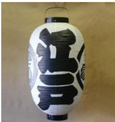
えどてがきちょうちん ④⑩ 江戸手描提灯