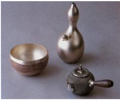
とうきょうぎんぎ ⑤東京銀器

えどじだい かくだいみょう ぜんこく あつ えど おお 江戸時代、各大名が全国から集まった江戸には、多 く しよくにん の職人が集まってきました。銀師 しろがねし と呼ばれた銀器 ぎんぎ 職人 しよくにん や、くしゃかんざし、神輿金具 みこしかなく をつくかざ しよくにん 職人が とうきょうぎんぎ きそ きす 東京銀器の基礎を築きました。