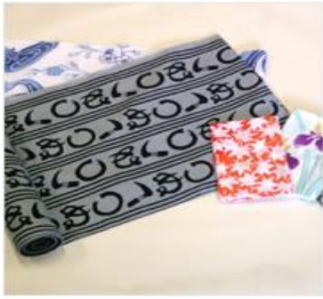
とうきょうほんぞめ ①9 東京本染ゆかた・