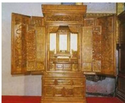
とうきょうぶつだん ⑫ 東京仏壇

ぶっきょう でんらい きょう まきもの け さ、その後 きそく れいふく ぶ し たいとう かぶと よろい かたな つかまき 貴族の礼服、武士の台頭により兜や鎧、刀の柄巻な はばひろ つか え どじだいこうき じょせい ど幅広く使われてきました。江戸時代後期には、女性の おび 帯じめとしても使われるようになりました。