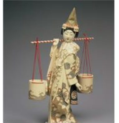
えどそうげ 江戸象牙