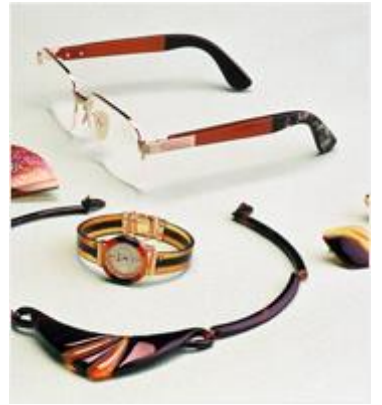
えどへっこう 江戸髷甲