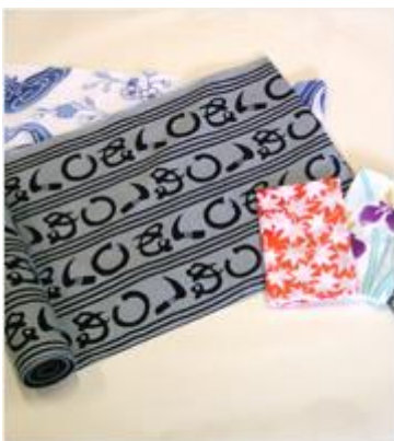
とうきょうほんそ 東京本染めゆかた