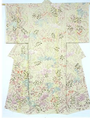
とうきょうてがきゆうぜん 東京手描友禅