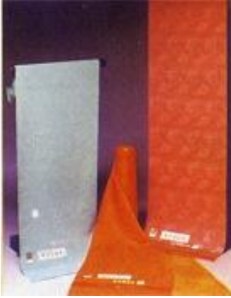
とうきょうむしぞめ 東京無地染