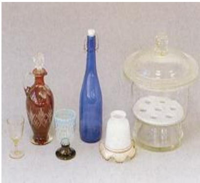
えどがらす 江戸硝子