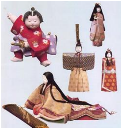
えどきめこみにんぎょう 江戸木目込人形