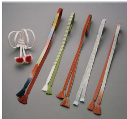
とうきょう 東京くみひも