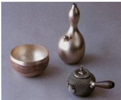
とうきょうぎんき 東京銀器