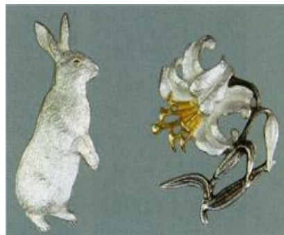
とうきょうちょうぎん 東京彫金