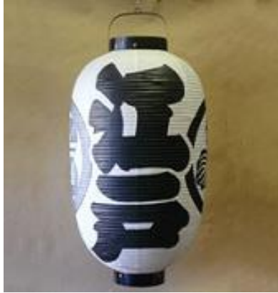
えどてがきちょうちん 江戸手描提灯