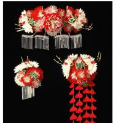
えどつまみかんざし 江戸つまみ簪