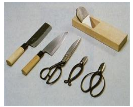
とうきょううちもの 東京打刃物