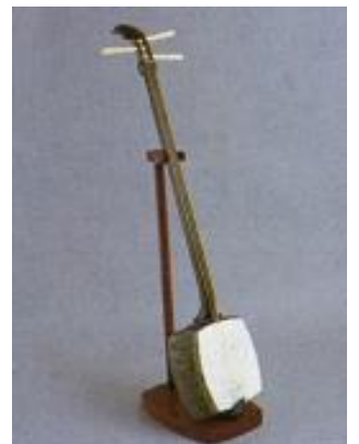
とうきょうしゃみせん 東京三味線