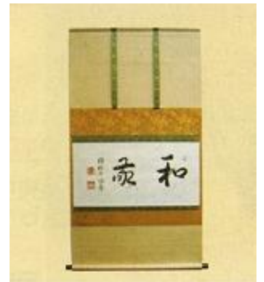
えどひょうく 江戸表具