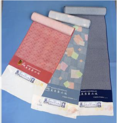
とうきょうそめこもん 東京染小紋