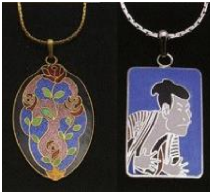
とうきょうしっぽう 東京七宝