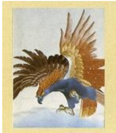
えどししゅう 江戸刺繍