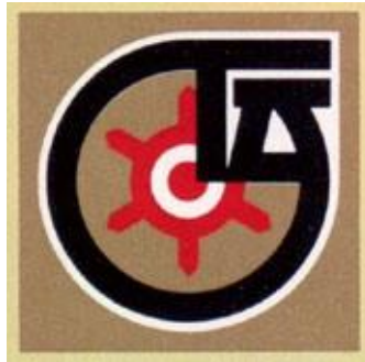
でんとう 伝統マーク