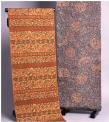
えどさらさ 江戸更紗